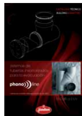
Phonoline Sistema de tubería insonorizada para la evacuación.

Consulte nuestra documentación técnica o solicite información a nuestro equipo de prescripción