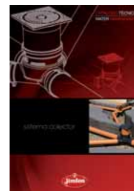
Sistema Colector Sistema modular para la evacuación de aguas.