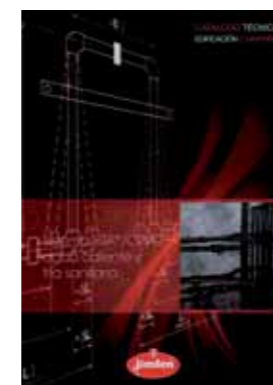
Sistema HTA/CPVC Conducción de agua caliente y fría sanitaria