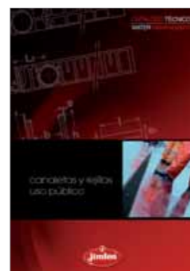
Sistema Kenadrain Soluciones de recogida y evacuación de aguas pluviales en suelo de uso público.